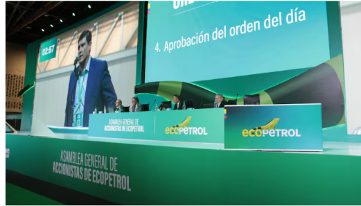
El punto central de la Asamblea General es la conformación de la nueva Junta Directiva, para lo que resta del periodo 2021-2025.

Los accionistas minoritarios pidieron suspender algunos puntos del orden del día, entre esos, el cambio de la Junta Directiva.