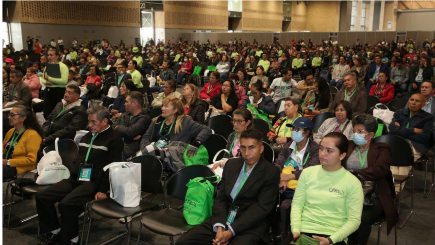
Asamblea general de accionistas de Ecopetrol

Como lo habían anticipado algunos analistas, en la asamblea de Ecopetrol es muy difícil que se posicione una voz disidente de la del Gobierno. El Estado es el dueño de la mayoría de acciones, el 88,5 %, por lo tanto, la administración de turno, que en la actualidad está en cabeza del presidente Gustavo Petro, tiene el control de las decisiones.