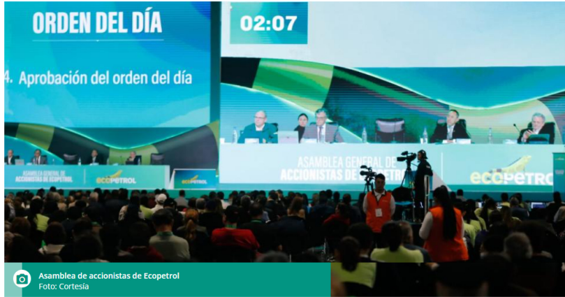
Asamblea de accionistas de Ecopetrol

Para repartir a los accionistas había $12,8 billones disponibles