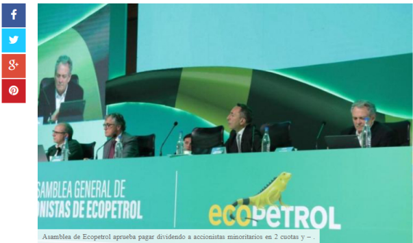
Asamblea de Ecopetrol aprueba pagar dividendos a accionistas minoritarios en 2 cuotas y - .

NEGOCIO Shirley Noticias 37 minutos ago REPORT