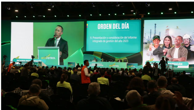
Hasta altas horas de la noche del viernes 22 de marzo se llevó a cabo la asamblea de accionistas de Ecopetrol

22 de marzo de 2024 Por: Redacción El País