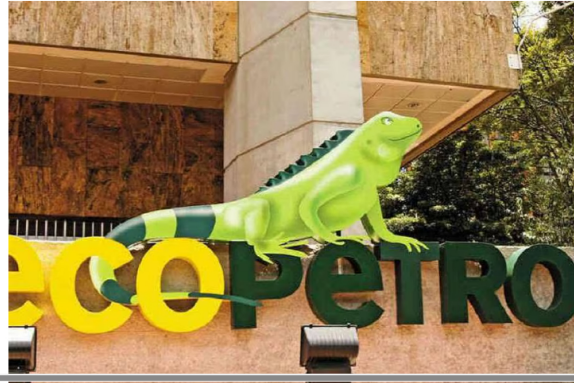
Logo de Ecopetrol.