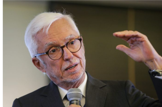
Jorge Enrique Robledo, exsenador de la República.