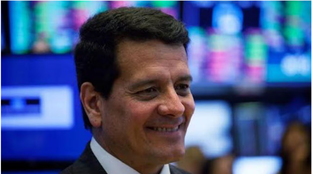
Felipe Bayón, expresidente de Ecopetrol , ahora entra a la Fundación She Is.

Muchos colombianos se estaban preguntando por él. Más aún ahora que se acerca la asamblea general de Ecopetrol , compañía que lideró durante 5,5 años y, por consiguiente, condujo la reunión anual de la petrolera, de la que hacen parte como accionistas minoritarios cientos de colombianos de a pie.