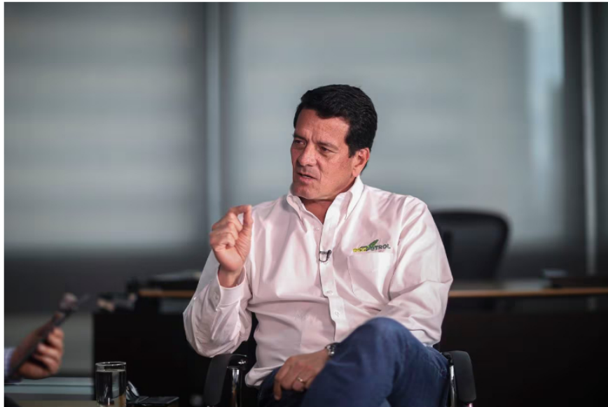
Felipe Bayón Pardo

Por su parte, el programa 'SHE IS Astronauta' ha apoyado a 736 niñas, gestionando 21 becas completas de carreras universitarias para jóvenes vinculadas al programa y 38 becas en innovación y emprendimientos para niñas que se encuentran en etapa escolar. Es decir, el nuevo trabajo de Bayón será poco menos que un bálsamo, luego de las tensiones que se suscitaron hace un año, cuando estaban en furor los cambios en la política para la industria extractiva y la transición energética.