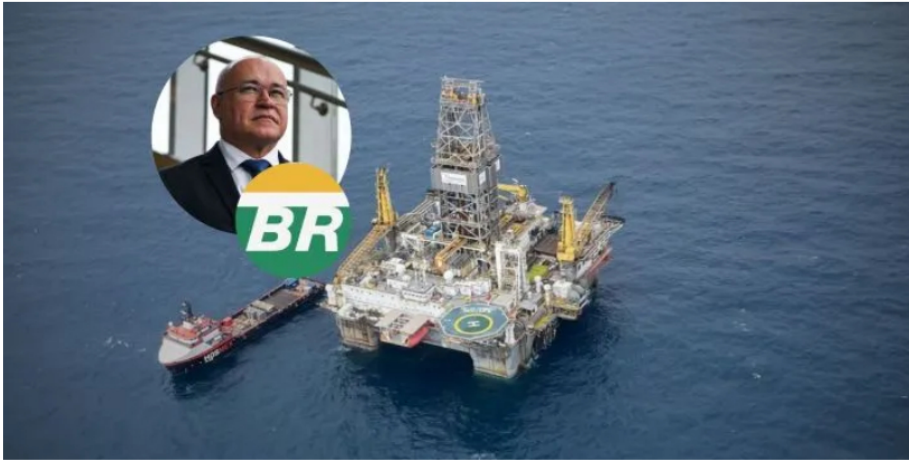
Joelson Mendes, director general de exploración y producción de Petrobras y pozo en Bloque Tayrona.

Un directivo de la petrolera brasileña se refirió a un pozo de gas en Colombia que podría ser más que suficiente para el país. Dice que el Gobierno pidió acelerar su perforación.