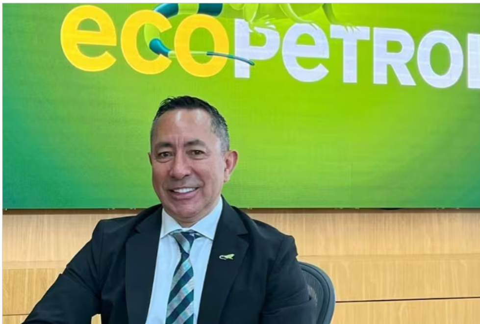
24/04/2023 El presidente de Ecopetrol , Ricardo Roa ECONOMIA ECOPETROL ECOPETROL - ECOPETROL