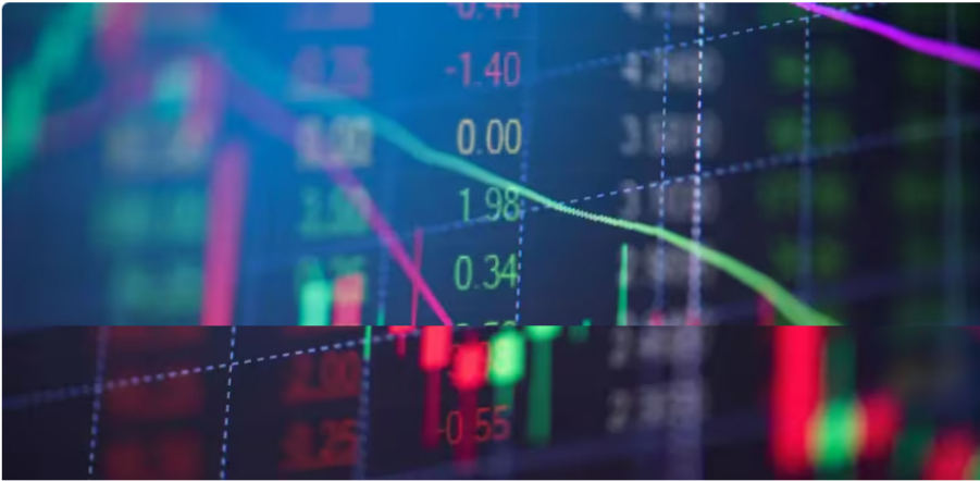
Acción de Ecopetrol se mantiene: precio y cotización en bolsa hoy 21 de marzo de 2024

Así se comportan las acciones de Ecopetrol en la Bolsa de Valores de Colombia este 21 de marzo