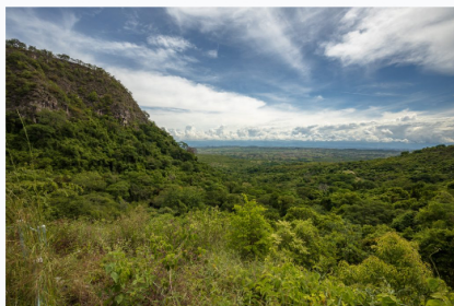
Ecoreserva La Tribuna

En el marco de dichas acciones de conservación se creó el proyecto Biomonitores, con la participación de 13 voluntarios de la comunidad, quienes trabajaron de manera voluntaria como coinvestigadores junto a 32 estudiantes de pregrado y posgrado, con el objetivo de generar conocimiento científico para cuidar las áreas.