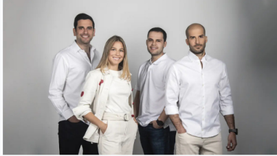
Las 30 promesas de los negocios 2024. Por José Caparoso