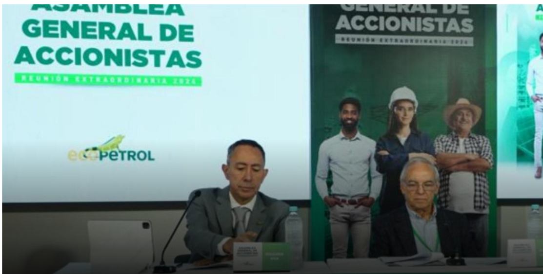
Ricardo Roa, presidente Ecopetrol y Ricardo Bonilla, ministro de Hacienda.

Pedirán que se revele informe sobre posibles riesgos y recomendación de apartarlo del cargo.