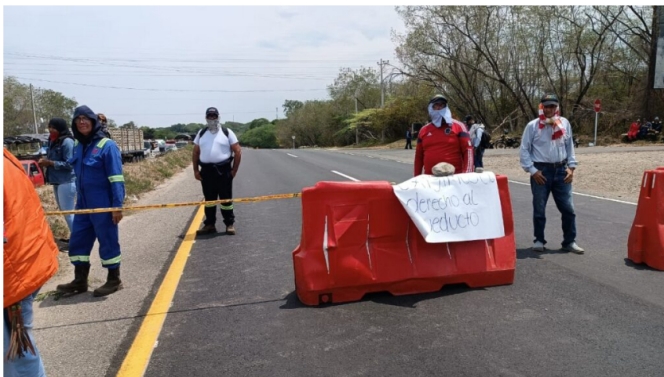
El bloqueo vial, hace parte de la manifestación pacífica de los habitantes de la vereda San Jorge.

La crisis del agua ha llevado a la comunidad a un punto crítico, donde la falta de higiene adecuada y la imposibilidad de preparar alimentos de manera segura amenazan con provocar brotes de enfermedades. Los residentes esperan que su protesta genere un diálogo significativo con las autoridades locales y Ecopetrol, en busca de una solución que ponga fin a su angustia.