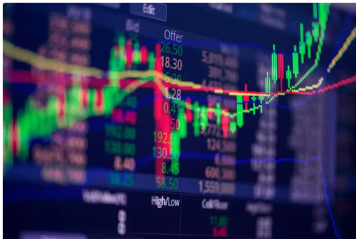
Acción de Ecopetrol se mantiene: precio y cotización en bolsa hoy 20 de marzo de 2024

Así se comportan las acciones de Ecopetrol en la Bolsa de Valores de Colombia este 20 de marzo