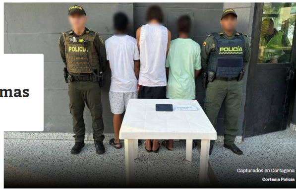
Capturados en Cartagena