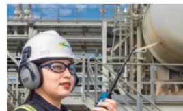
Mujeres en Ecopetrol : Rompiendo barreras y fomentando la equidad de género