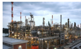
Ecopetrol : Reducción exitosa de 341 mil toneladas de CO2 en operaciones