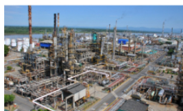
El impacto de la desinversión de Ecopetrol en la ciudad de Barrancabermeja