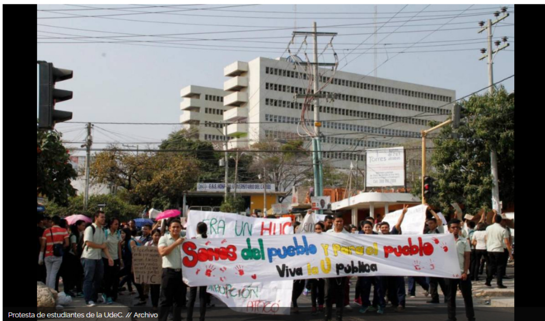
Protesta de estudiantes de la UdeC.

El fallo ordena a la Universidad de Cartagena devolver $200 mil millones a la empresa petrolera, lo que comprometería su situación económica.