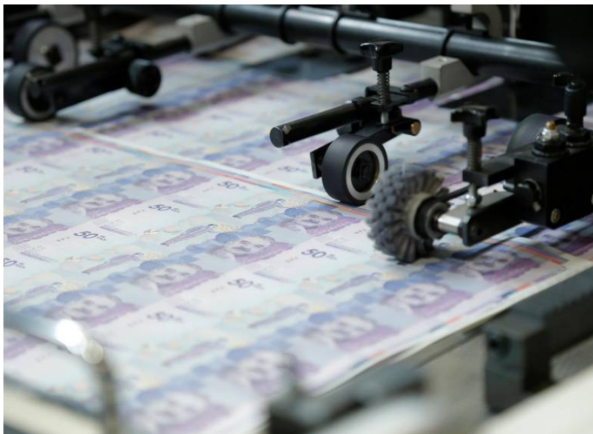
A comienzos de este mes el Gobierno anunció la propuesta para ampliar el cupo de deuda.

La ampliación del cupo de endeudamiento es un trámite que se realiza cada 3 años aproximadamente.