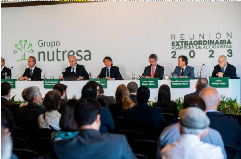
En la asamblea de Nutresa, las directivas propondrán que no se pague dividendo este año.

Las propuestas de Ecopetrol , Mineros y Bancolombia figuran como las más