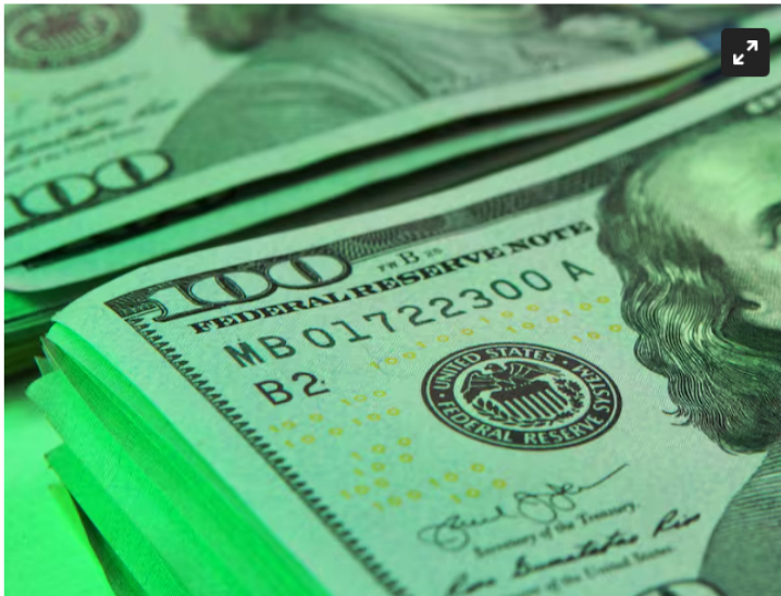
Imagen de cerca de paquete de dólares estadounidense

Si bien en la mañana el dólar abrió por encima de los $3.900, en las últimas horas regresó a su tendencia a la baja, alcanzando un nuevo mínimo en la semana. Le contamos en cuánto está el precio de esta divisa cerca al cierre de la jornada