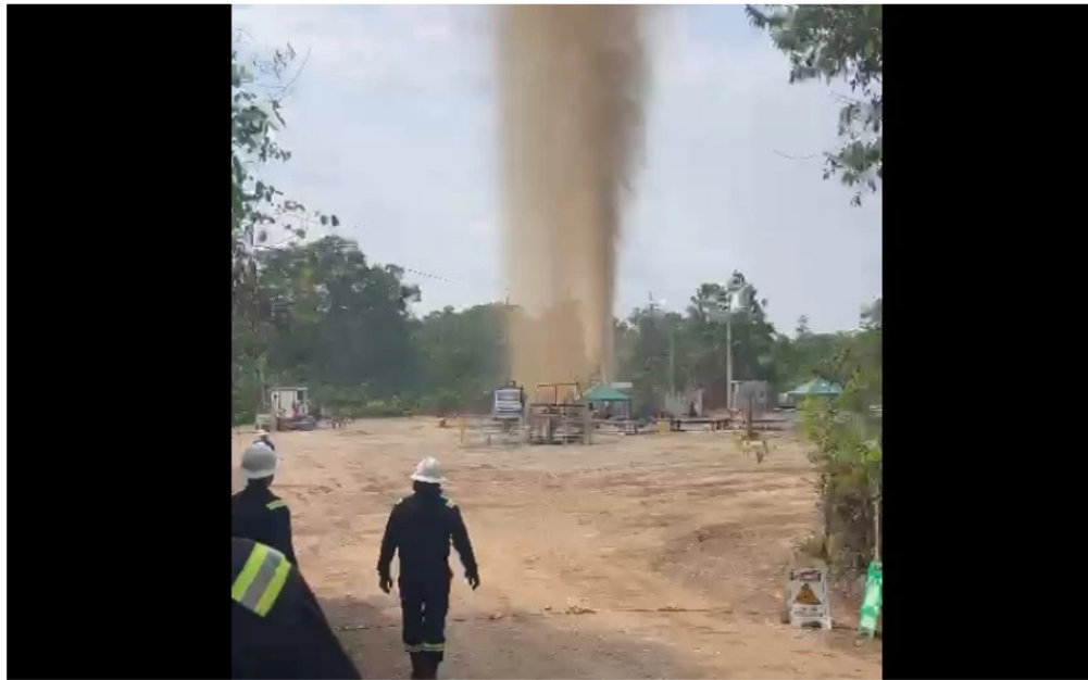
Emergencia en Barrancabermeja.

En video quedó registrado el momento exacto que se genera la emergencia tras la explosión del pozo petrolero.