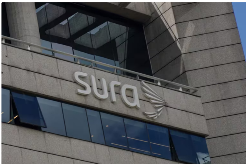
Sura fue la segunda empresa con mayores utilidades en Colombia