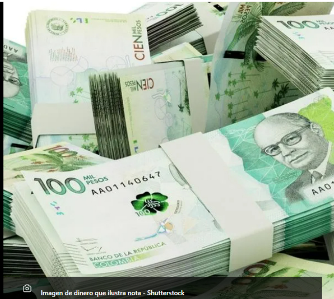
Imagen de dinero que ilustra nota