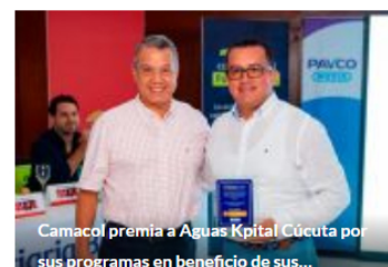
Camacol premia a Aguas Kpital Cúcuta por sus programas en beneficio de sus...