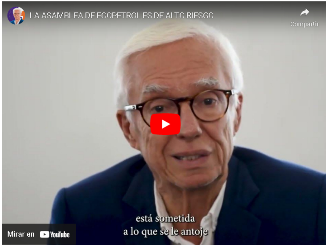
Jorge Enrique Robledo

Mantente Actualizado Síguenos en Google Noticias