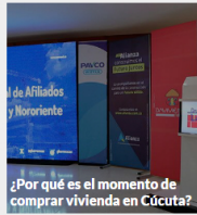
¿Por qué es el momento de comprar vivienda en Cúcuta?