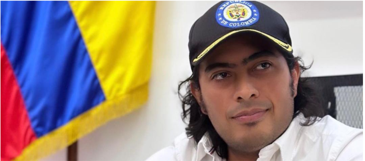
Nicolás Petro.