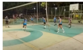
Final del XIV torneo de voleibol femenino en Barrancabermeja