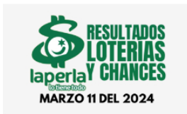
Resultados de chances y loterías del Lunes 11 de marzo de 2024