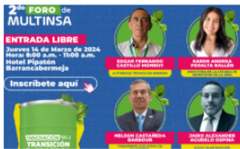
Foro de Transición Energética en Barrancabermeja