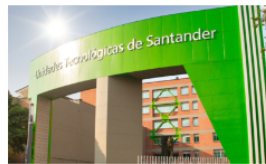
Aprobado presupuesto para construcción de sede UTS en Barrancabermeja