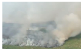
Aumenta la contaminación del aire en Barrancabermeja