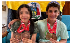
Patinadores de Barrancabermeja destacan en competencia nacional de patinaje