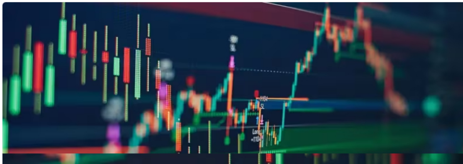
Acción de Ecopetrol , al alza: precio y cotización en bolsa hoy 13 de marzo de 2024

Así se comportan las acciones de Ecopetrol en la Bolsa de Valores de Colombia este 13 de marzo