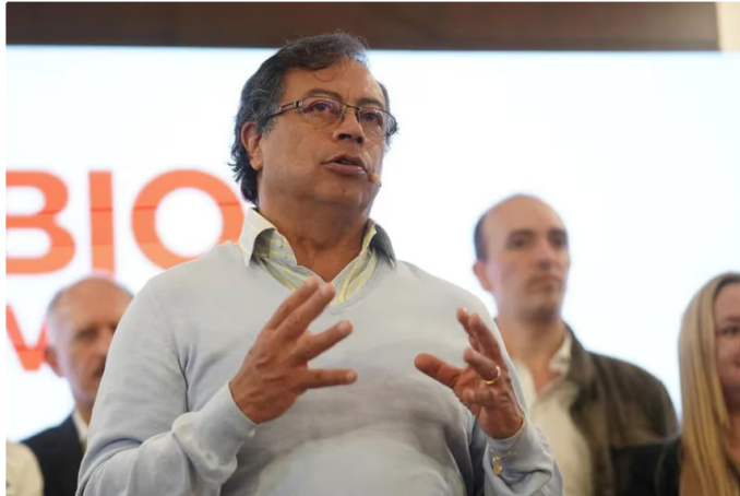
Gustavo Petro en un evento de campaña.

Desde la Unión Sindical Obrera (USO) insistieron en que en 2022 no donaron dinero directamente a la campaña del hoy presidente, Gustavo Petro, luego de que la semana pasada se conociera una investigación en las que señalaban que esa organización de trabajadores supuestamente entregaron 600 millones para ese fin.