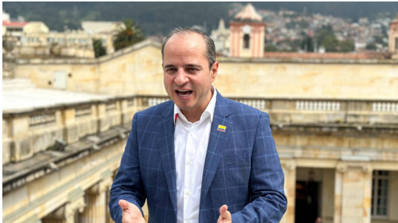
Juan Espinal Colprensa

Publicado: Lunes, Marzo 11, 2024 - 08:09 | Actualizado: Lunes, Marzo 11, 2024 - 08:36