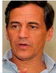
Por Rafael Nieto Loaiza