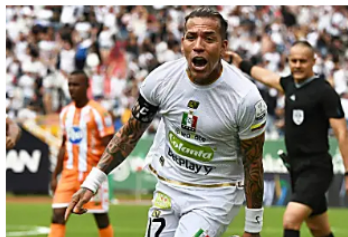
Máximos goleadores de la historia del fútbol colombiano: así queda el ranking