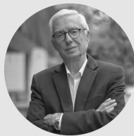
Jorge Enrique Robledo