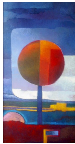
Abat a las 5 pm