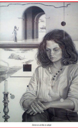
Como es arriba es abajo