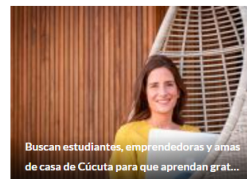
Buscan estudiantes, emprendedoras y amas de casa de Cúcuta para que aprendan grat...