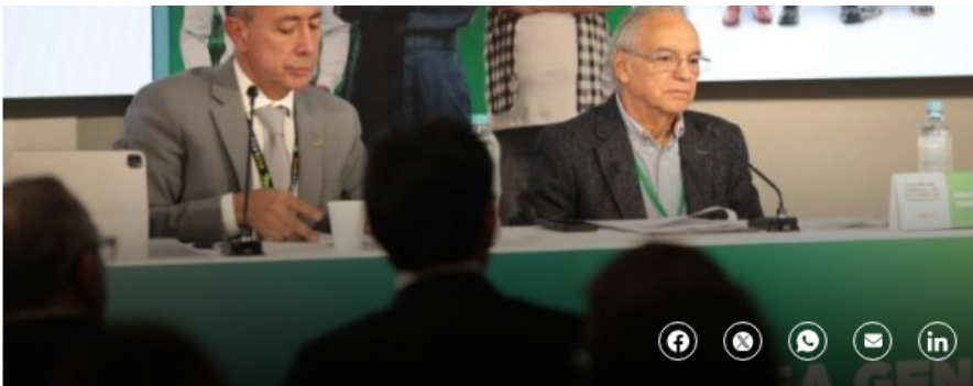
El presidente de Ecopetrol , Ricardo Roa; y el Ministro de Hacienda, Ricardo Bonilla.