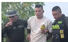
ACTUALIDAD / 4 días ago Capturan a «Brayan» por tentativa de homicidio