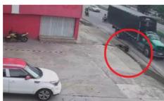
NOTICIAS / 4 días ago Joven universitario gravemente herido tras ser arrollado en Piedecuesta