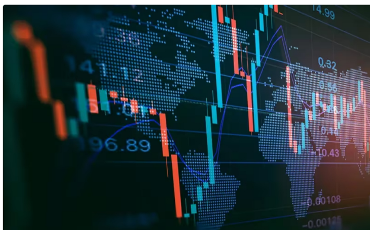
Acción de Ecopetrol cae: precio y cotización en bolsa hoy 8 de marzo de 2024.

Así se comportan las acciones de Ecopetrol en la Bolsa de Valores de Colombia este 8 de marzo