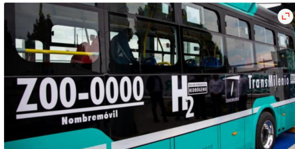
1/2 Bus de hidrógeno de Bogotá Transmilenio

Lea también: ¿Se quedó sin saldo? Tranquilo veci, vea cuántos pasajes le presta TuLlave