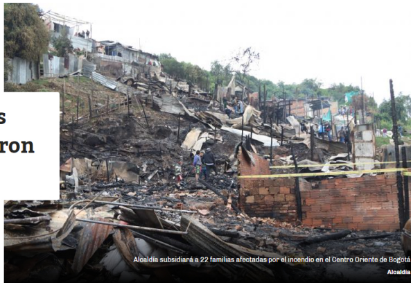
Alcaldía subsidiará a 22 familias afectadas por el incendio en el Centro Oriente de Bogotá

Por: Gelitza Rocio Jiménez Cerquera @JimenezGelitza