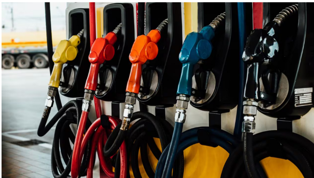
Casi la totalidad del comercio nacional y exterior se mueve a través de vehículos de carga operados con diésel.

7 de marzo de 2024 Por: Redacción El País