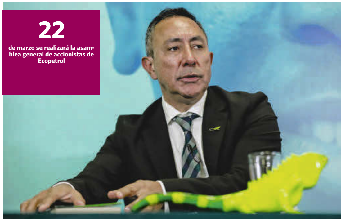
Se está a la espera de qué va a pasar con la lista de candidatos a la junta que pasó el Gobierno Nacional, como accionista mayoritario de Ecopetrol.