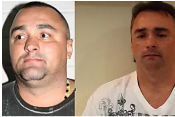
Doble homicidio en el Poblado, uno podría ser un reconocido jefe criminal de La Terraza