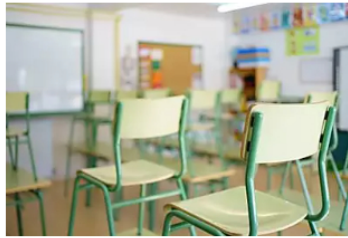
"Futuro de la educación en Colombia": reviva los mejores momentos en Hora20 Caracol Radio