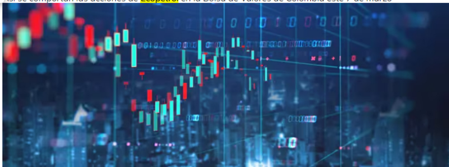
Acción de Ecopetrol , al alza: precio y cotización en bolsa hoy 7 de marzo de 2024

Así se comportan las acciones de Ecopetrol en la Bolsa de Valores de Colombia este 7 de marzo