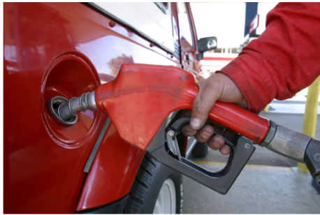
Los transportadores aseguran que con el aumento, también incrementará el precio de los alimentos.

Lo cierto es que hasta el momento, el Gobierno Nacional no ha decretado ningún aumento, y por lo visto, podría ocurrir, pero en próximos meses.