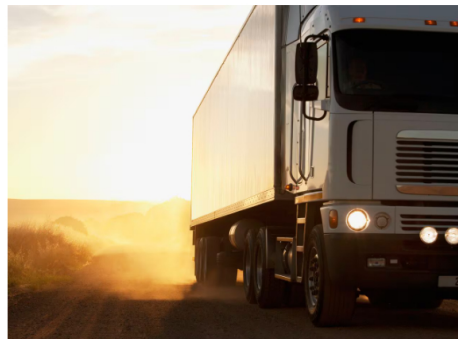
Los vehículos de carga serían los principales afectados con el aumento.

Frente a esto, Bonilla aseguró que "eso es un tema que tenemos que mirar con más calma por las implicaciones que tiene con respecto al transporte masivo y al transporte de carga".