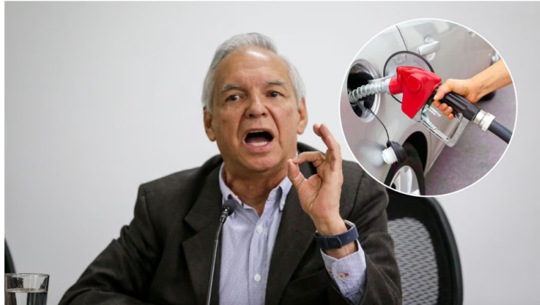
El ministro de Hacienda, Ricardo Bonilla, se pronunció sobre el posible incremento del precio del ACPM en el país.

6 de marzo de 2024 Por: Redacción El País