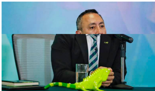
Por el momento, se está a la espera de qué va a pasar con la lista de candidatos a la junta que pasó el Gobierno Nacional, como accionista mayoritario de Ecopetrol.