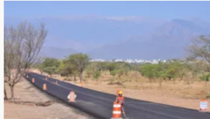
Aumento inusitado de precio en segunda calzada Valledupar - La Paz: de $70.000 a $116.000 millones