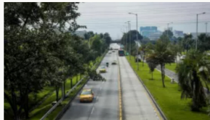
Alerta ambiental en Bogotá por calidad del aire: estas las restricciones a la movilidad y otras medidas