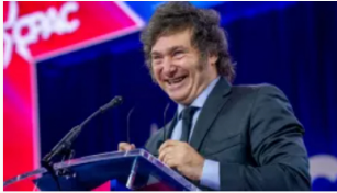
Tras anuncios de presidente Javier Milei, empresas argentinas suben en Wall Street