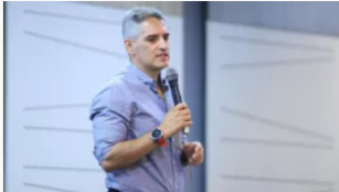
Gobernador de Antioquia conmina a presidente Petro por recursos para finalizar dos obras clave