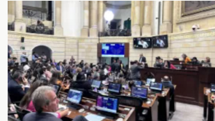
Trasfuguismo político: radican proyecto de reforma constitucional que lo permite