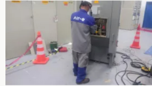
Superintendencia de Servicios Públicos pone en la mira a la empresa Air-e