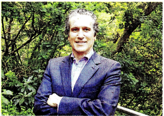
Grupo Energía Bogotá