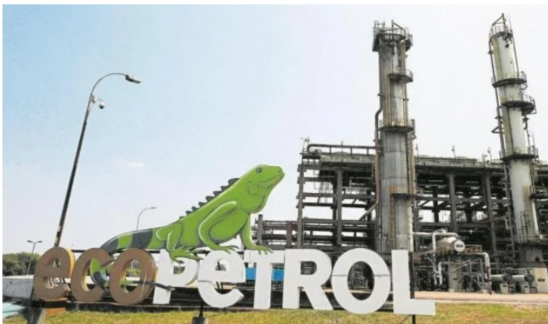
Venezuela y SPEC: las cartas de Ecopetrol para suplir déficit de gas desde 2025.

Recientemente, Valora Analitik expuso que la petrolera colombiana, Ecopetrol , había desistido de sus acuerdos comerciales de hidrocarburos (especialmente gas natural) con Venezuela, incluso, antes de la reactivación de las sanciones de Estados Unidos sobre este país, pero ¿se seguirá insistiendo en importación por este lado?