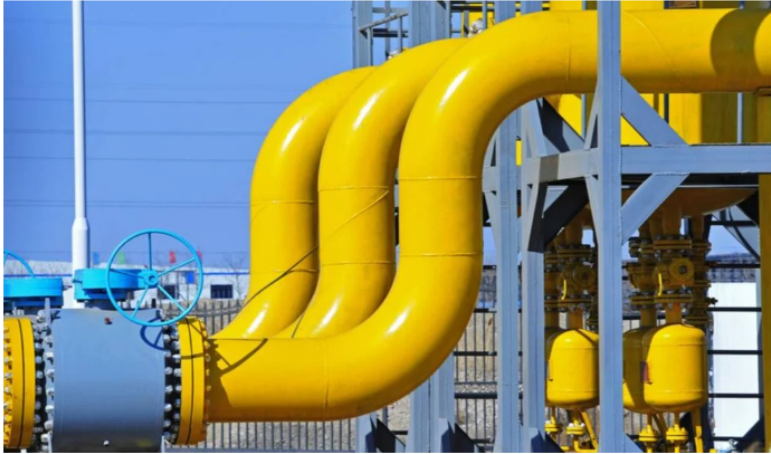
Gas natural en Colombia.

Cuando se habla de infraestructura, Roa se refiere a la reactivación de un contrato que está suscrito sobre 2007 firmado entre PDVSA y Ecopetrol . “Hoy, prácticamente, por estar vigente al año 2027 se vuelve el vehículo jurídico de primer alcance para poder evaluar. Eso comporta la evaluación de la integridad de ese tramo de gasoducto en el territorio colombiano, que en algunas partes está afectado, pero en su mayoría ellos no”, manifestó el presidente de la petrolera.