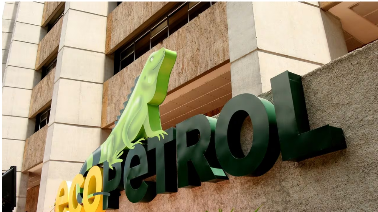
Estas son las ofertas que lanzó Ecopetrol . Tienen 316 cupos.

Ecopetrol es una de las empresas más grandes e importantes de Colombia. La petrolera, fundada en 1951, es además la segunda empresa de hidrocarburos más grande de Latinoamérica y se encarga de todos los procesos en la cadena productiva de los hidrocarburos, desde la explotación, hasta la posterior comercialización del crudo.